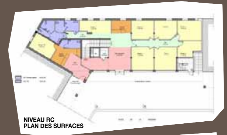
NIVEAU RC PLAN DES SURFACES