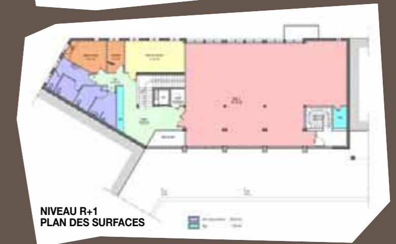
NIVEAU R+1 PLAN DES SURFACES