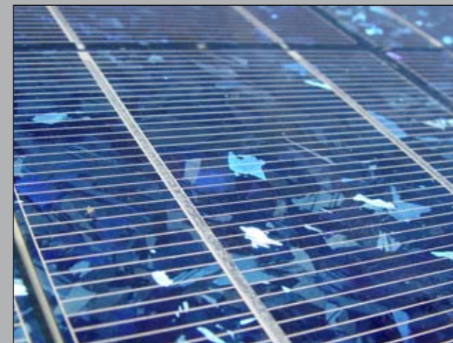
Patrimoine et modernité