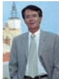
M. Jean-Paul Alduy Maire de Perpignan, Sénateur des Pyrénées-Orientales.

Pour la 5 e fois depuis 2001, la fiscalité de Perpignan n'augmente pas en 2006 et Perpignan, de façon incontestable, est une des villes où la part communale de fiscalité sur la feuille du contribuable est la moins élevée :