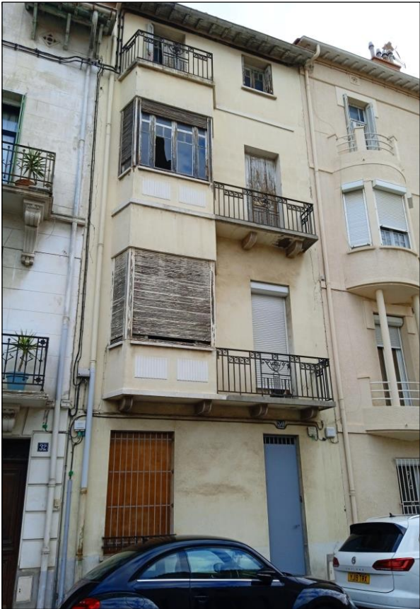
Façade (rue Cabrit)