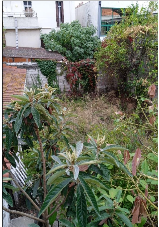
Vue du Jardin