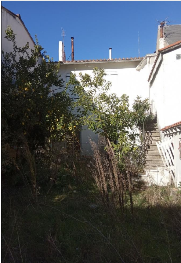
Façade arrière et jardin