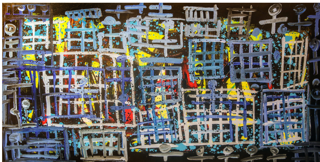
Série Favelas , acrylique sur toile, 195 x 97 cm.