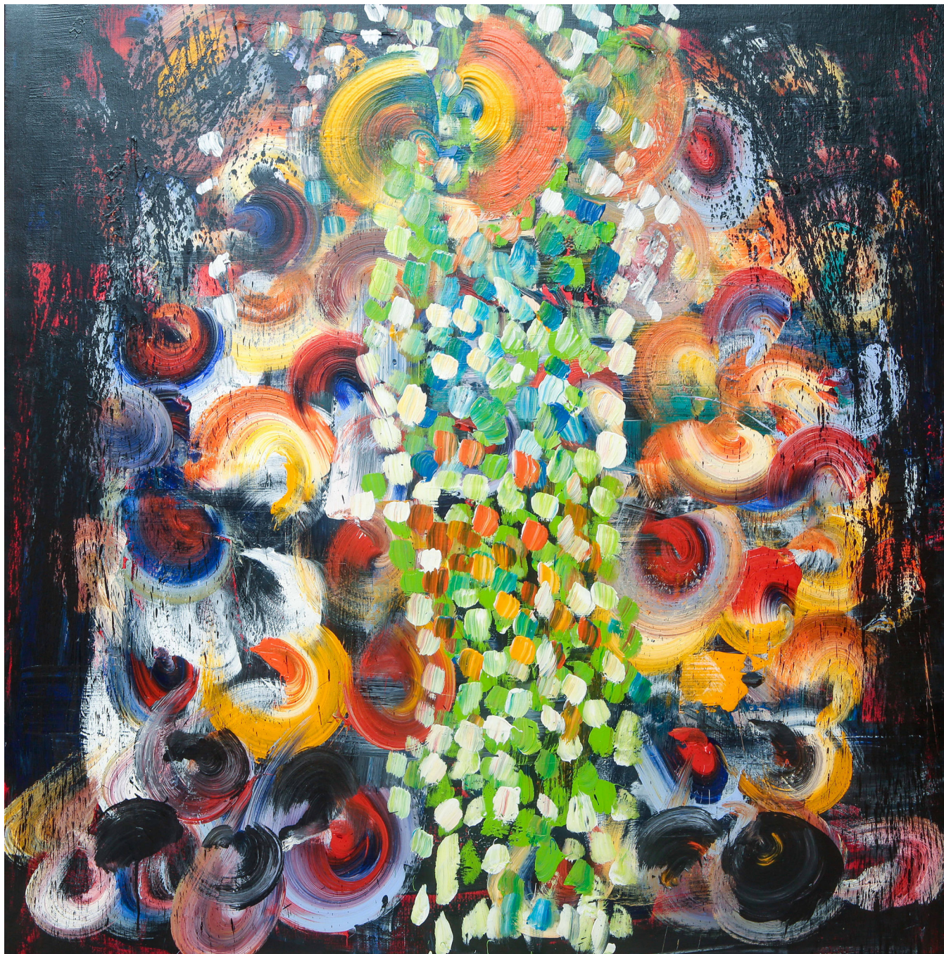
Série Favelas , acrylique sur toile, 150 x 150 cm.