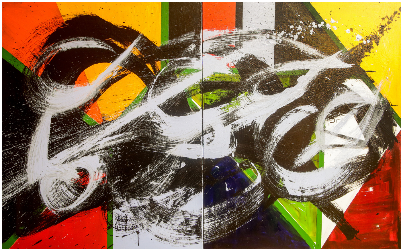
Série Champ profond , acrylique sur toile, 200 x 120 cm.